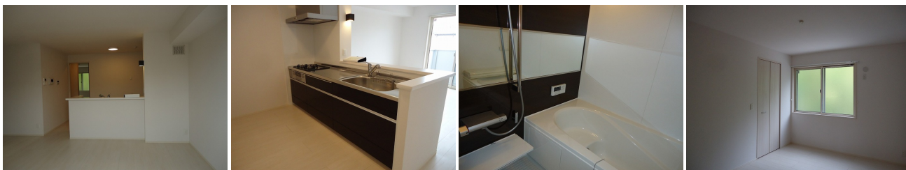
LDK システムキッチン 浴室(浴室換気乾燥機、追焚給湯) 北西洋室