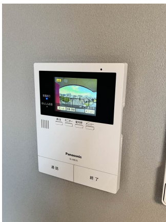
■モニター付きドアホン