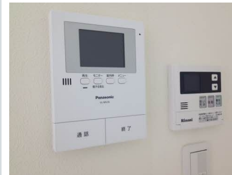
■カラーモニターホン、