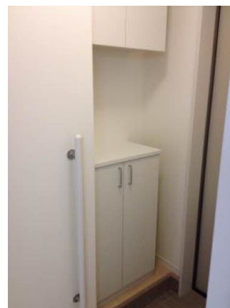
■シューズボックス