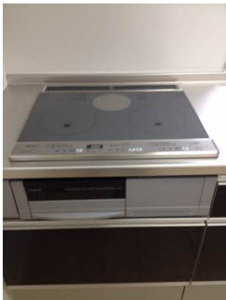
■IHクッキングヒータ