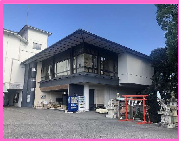
白崎八幡宮の境内にある建物です。 1Fはレストランです。