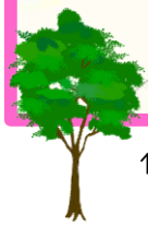
↑今津川沿いの神社の境内にあります。 窓からは参道の木々が見えます。