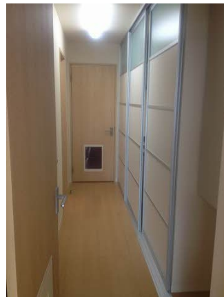
■キッチン隠しスクリー