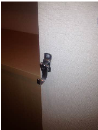
■ 玄関内リードフック