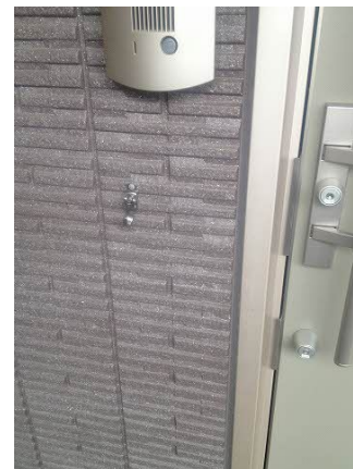
■玄関外リードフック