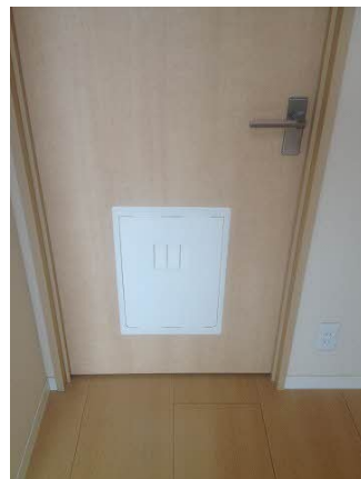
■ペットドア付建具