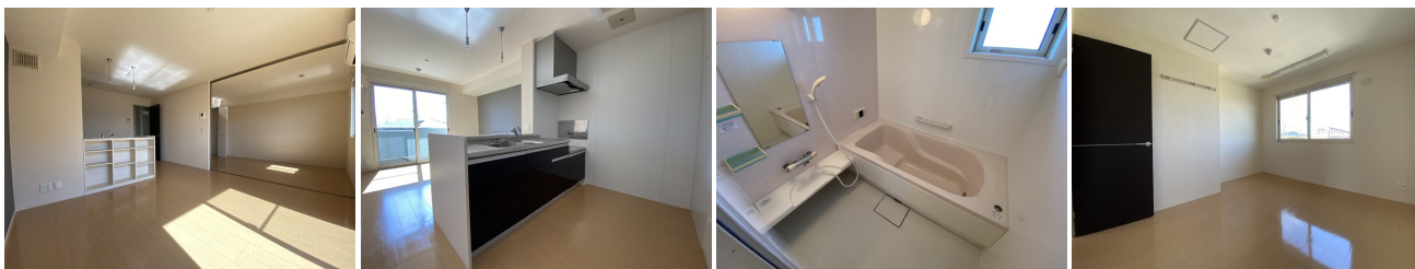
LDK キッチン バス 洋室